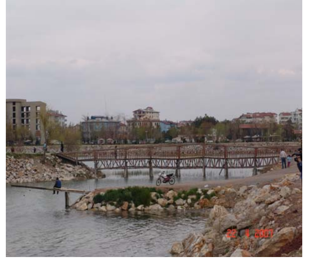
Şekil 1. Beyşehir Gölü Regülâtörü ve Tarihi Köprü'nün yağışın çok fazla olduğu 1981 yılına ait taşkın görüntüsü (Sol üst). Nisan 2007 tarihinde Beyşehir Gölü Yeni köprü, Tarihi köprü ve dolgulardan görüntüler (Sağ üst ve alttaki resimler)